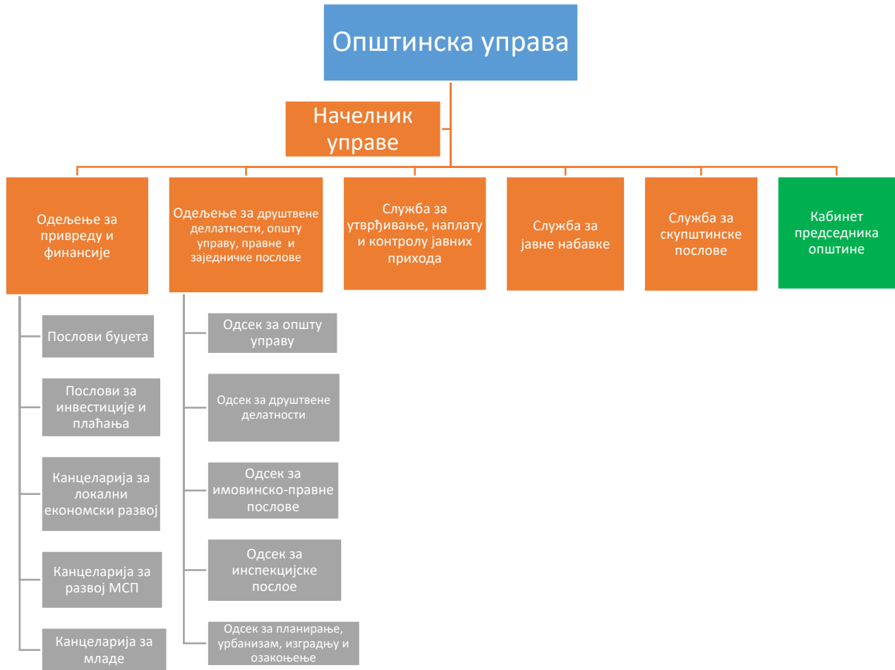
Дијаграм 2: Организациона структура Општинске управе општине Ражањ

У Општинској управи као посебне организационе јединице функционишу: Служба за утврђивање, наплату и контролу јавних прихода; Служба за јавне набавке; Служба за скупштинске послове; Кабинет председника општине (Дијаграм 3).